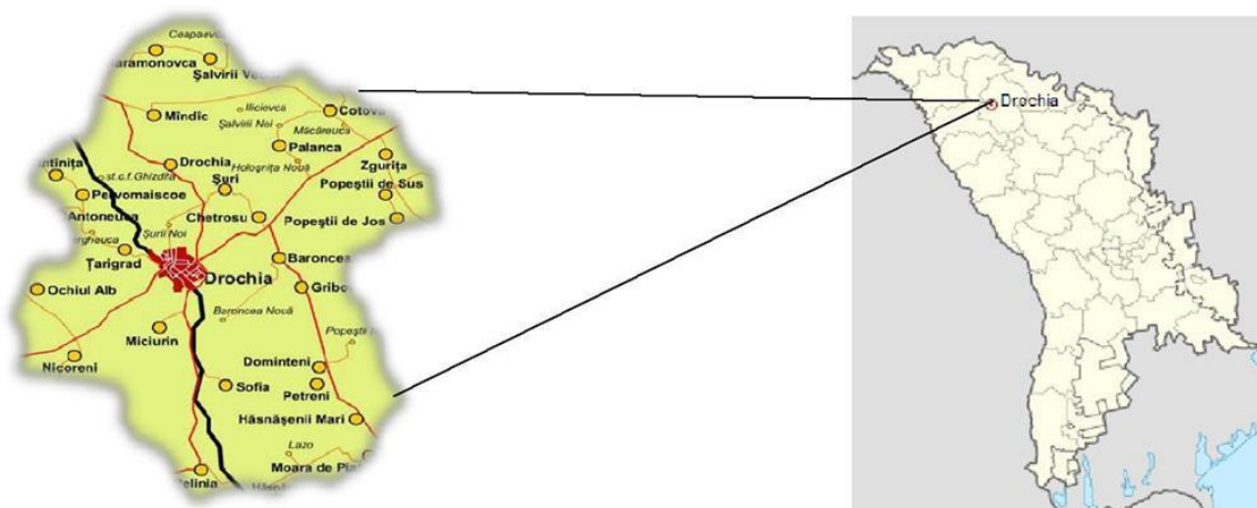
Figura 1. Așezarea geografică a s. Țarigrad.

Țarigrad este un sat din raionul Drochia. Satul este situat la 48.044564 - latitudine nordică și 21.760657 - longitudine estică, având o suprafață de aproximativ 4.46 km 2 , cu un perimetru de 9.74 km. Satul Țarigrad are o suprafață totală de 41.32 km 2 , fiind cuprinsă într-un perimetru de 33.36 km. Suprafața teritoriului administrativ constituie 4065,33 ha. Satul Țarigrad este situat în partea de Nord-vest a raionului Drochia, la o distanță de 4 km de centrul raional și 185 km de capitala Republicii Moldova-Chișinău, și la o distanță de 35 km de orașul Bălți., 4 km de stația de cale ferată Drochia. La Nord satul este mărginit de teritoriul satului Sergheevca, la Sud – or. Drochia, la Vest – s. Ochiul Alb.