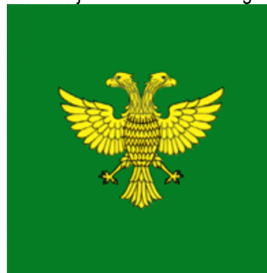
Figura 2. Stema și drapelul s. Țarigrad.